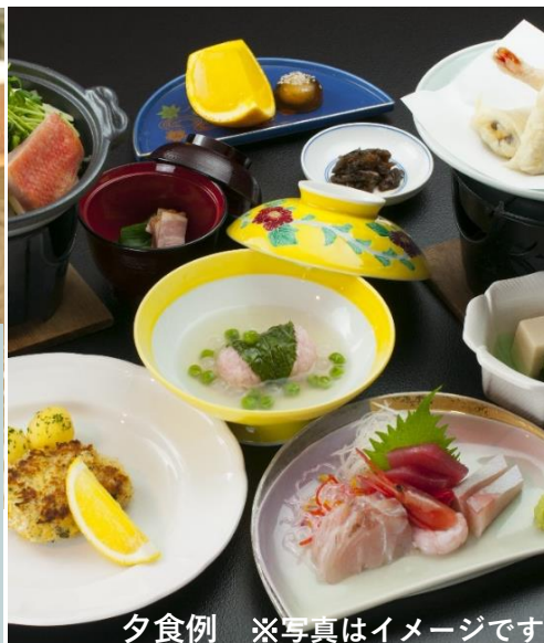
夕食例 ※写真はイメージです